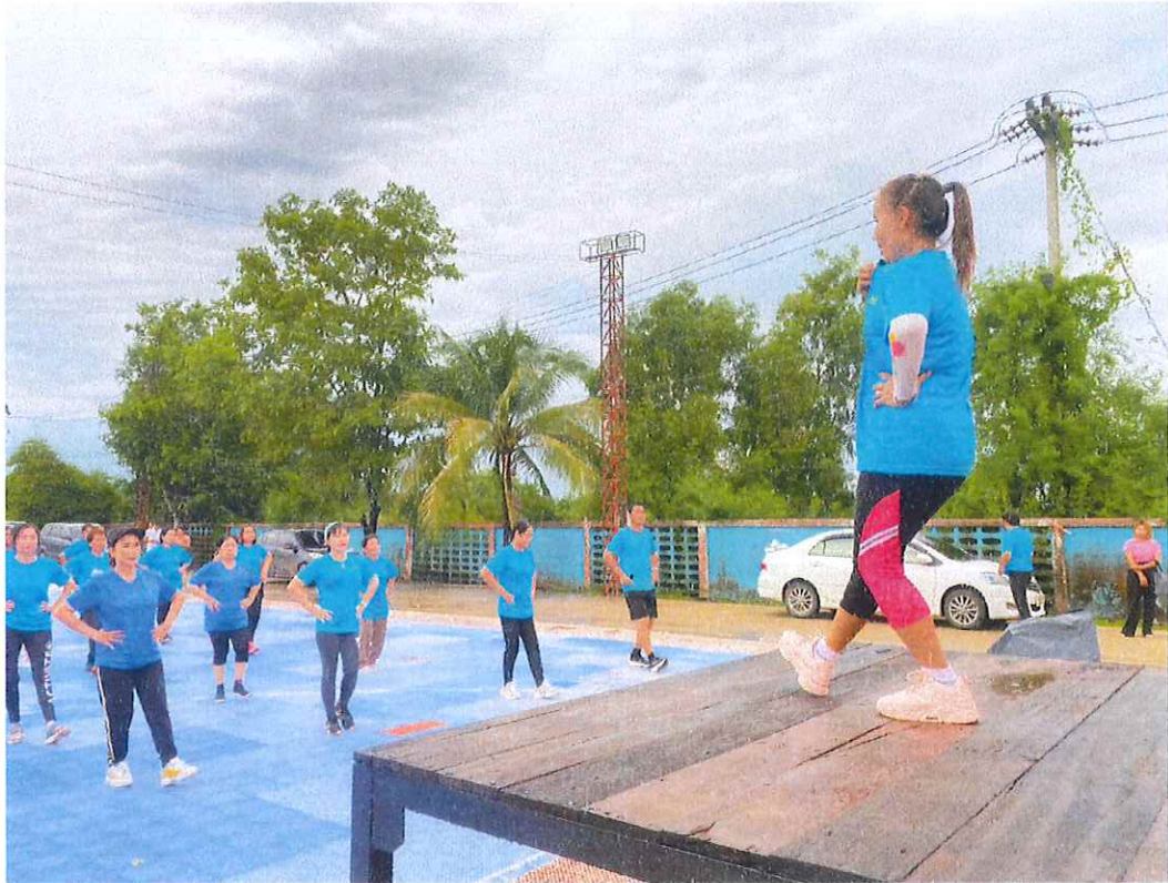
จัด event ออกกำลังกาย เช่น แอโรบิก เดิน-วิ่งจักรยาน