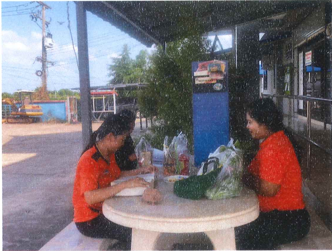
จัดสถานที่พักผ่อนหย่อนใจ